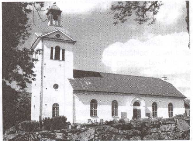
Starrkärrs kyrka

Avskrift av lagfart som skrevs när min morfarsmorfar köpte en del av gården från sin svägerska och bror. Gården delades då mellan två bröder och det är min bror som nu äger den gård de köpte 1827.