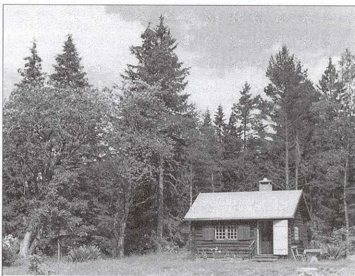
Jaktstugan där torpet Källeberg låg.

De gamla åkrarna syns ännu tydligt, med stenmurar och jordvallar fastän de är skadade av skogskörslor och vägbyggen. Många åkrar är försumpade trots en del dikning, men avrinningen är dålig när ingen torpare går där